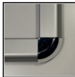
narożnik zaokrąglony kolor srebrny chrom