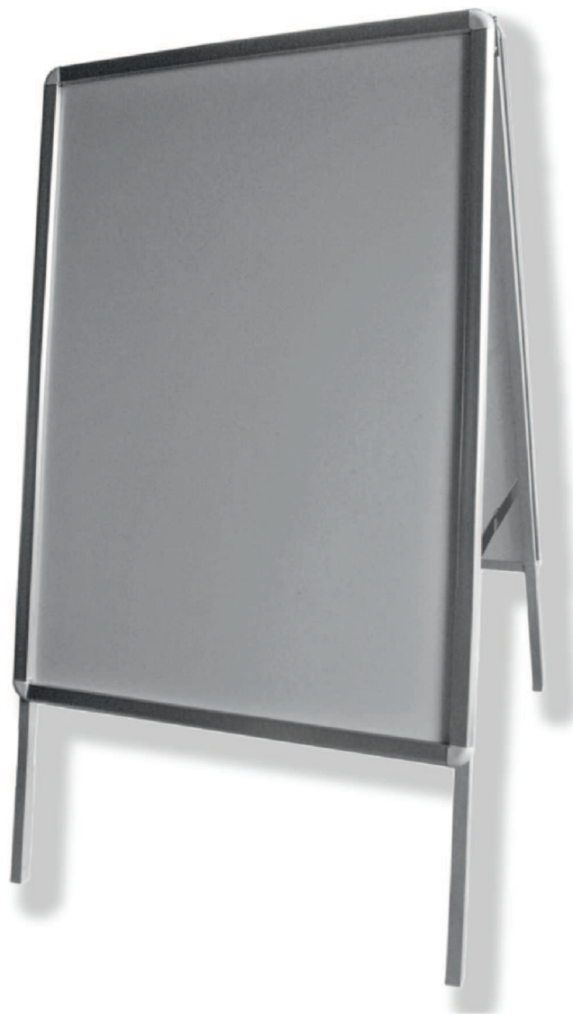
Na zdjęciu stojak z ramami OWZ formatu B1 P3SD1 (narożniki zaokrąglone).

Przy zamówieniu stojaków P3SJ1 w których ramy owz posiadają narożniki zaokrąglone przysługują następujące rabaty : dla formatów B0, B1, A0 A1: 3zł do każdego stojaka dla formatów B2, A2: 2zł do każdego stojaka